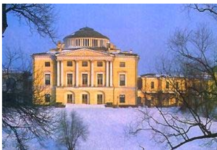
3. Павловский Дворец