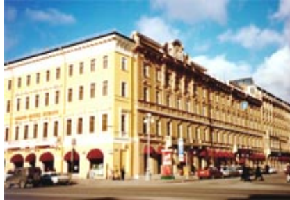
Гранд-отель “Европа” 5 звёзд