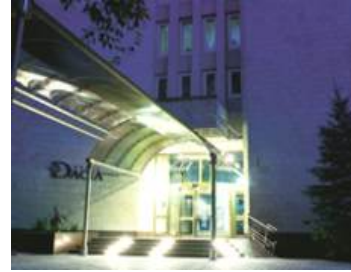
Гостиница “Дасия” 4 звезды