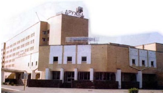
Гостиница “Дружба” 3 звезды