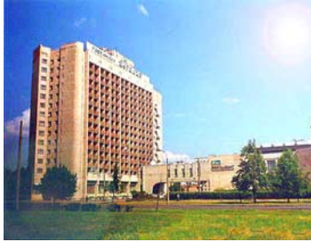
Гостиница “Карелия” 3 звезды

Work in pairs. You are working for an advertisement agency and your assignment is to write short (2-3 sentences) ads for the hotels below, mentioning their facilities, location, and rates. The instructor will assign you a picture of one hotel. Each pair of students advertises their hotel in the class and then everyone votes on which ad was the most interesting and descriptive. You can use the text in Activity 4 to help you.