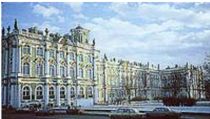
1. Зимний Дворец

Как правило, комнаты, где Романовы обедали, спали, читали каждый день, находились на первом этаже. Комнаты же на втором этаже были самые красивые и большие. Там проходили официальные обеды, когда во дворце были гости. Всего во дворцах было не меньше трёхсот комнат.