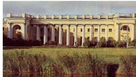
2. Александровский Дворец