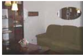
Типовой интерьер наших квартир