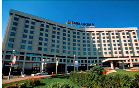
Гостиница “Рэдиссон-Славянская” 5 звёзд