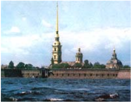
Санкт-Петербург, Петропавловская крепость

Tip of the Day: Interesting dates and facts to know: Санкт-Петербург was established by Czar Peter I in 1703. In 1712, it became the capital of Russia. In 1914, when WWI broke out, the city was renamed to Петроград to make it sound more Russian in view of the advance of the German forces. In 1918, after the Bolshevik Revolution the capital of the country was moved back to Moscow. In 1924, when Vladimir Lenin died, the city was renamed to Ленинград . In 1993, after the collapse of the Soviet Union and the communist ideology, the city was again given its original name Санкт-Петербург .