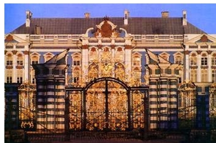
4. Екатерининский Дворец