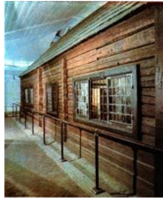
6. Домик Петра Первого